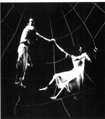
En la larga nómina de grupos españoles, figura El Globo de Sevilla con "Jojo", su último trabajo.

Además de las representaciones, habrá como en la edición anterior coloquios con los grupos participantes. La editorial canadiense Girol Book Inc. lanzará en Cádiz el segundo volumen del "Anuario crítico del teatro latinoamericano", y la librería madrileña