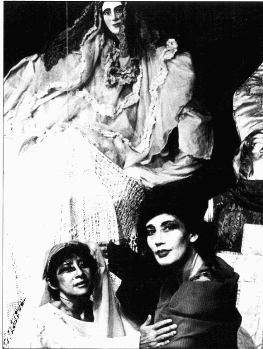
Diez años después de su primera visita, el T.E.C. vuelve a España con "El encierro".

Veintiséis grupos, en representación de once países latinoamericanos, además de España y Portugal, se presentarán en el Festival Iberoamericano de Teatro de Cádiz, cuya segunda edición se realizará entre el 4 y el 13 de octubre, con el más bien exiguo presupuesto de treinta y siete millones de pesetas.