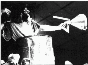
Los ecuatorianos traen una recreación de la commedia dell'arte; los portugueses, un Tennessee Williams.