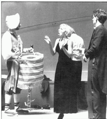
El tamborilero del Bruc acude en socorro de las raíces autóctonas para librarse del francés.