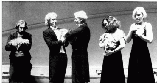
Detrás de la "alta" cultura, un botón de estulticia.