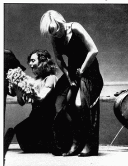
El concierto se troca en virtuosismo escatológico, previa exhibición de intimidades.