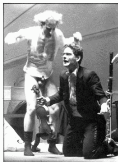
Los virtuosos se autonmolian a calzon quitado ante la fuerza del tópicoindependentista.

cas de su país, esencia nutricia de sus géneros, y son capaces de entonar una fuga de Bach en base al nombre de sus quesos y caldos más cualificados. La culminación de ese encadenamiento de gags llega a la cuspide cuando los virtuosos son capaces de establecer, experimentalmente, el rigor científico que media entre su música y su cocina. Nada mejor para ello que confeccionar una tortilla francesa, con gallo que no gallina en acción depositaria, a los acordes de La Marseillesa. Los mismos minutos, con idénticos segundos e incluso décimas de segundo en la ejecución de ambos productos.