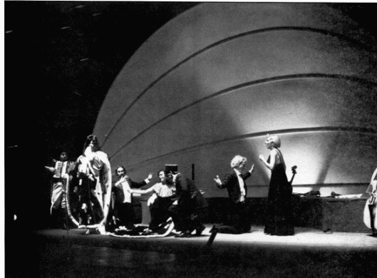
Los virtuosos promueven la estimulación del tópico.

Dos horas antes de que se iniciara la primera función ya tenía Joglars a su público arremolinado ante las puertas del Aula de Cultura. En la mentalidad del respetable, un único punto de referencia: