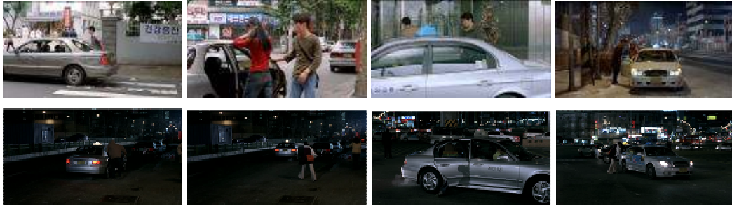
Virgin stripped bare by her bachelors (the same scene from two angles in 1 st and 2 nd part)