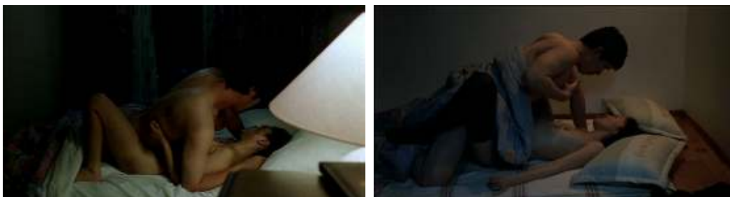
El poder de la provincia de Kangwon / Un cuento de cine: la cámara como crudo testigo.

Las escenas de sexo, en cambio, se muestran frontalmente, a veces con crudeza. Es el verdadero lugar de encuentro, el momento en que se resuelve la tensión entre hombres y mujeres, pero que, para asombro de los personajes masculinos, no cierra la narración, ni siquiera les consuela de su frustración, ni les cura de su obsesión. Los personajes femeninos las viven con placer o con paciencia, según los casos. Hong Sang-soo filma estas escenas sin adornos, como un observador silencioso que asiste a la transacción entre los cuerpos (aunque es inevitable percibir su mano burlona en la torpeza manifiesta de alguno de sus personajes o el exceso de expectativas de otros).