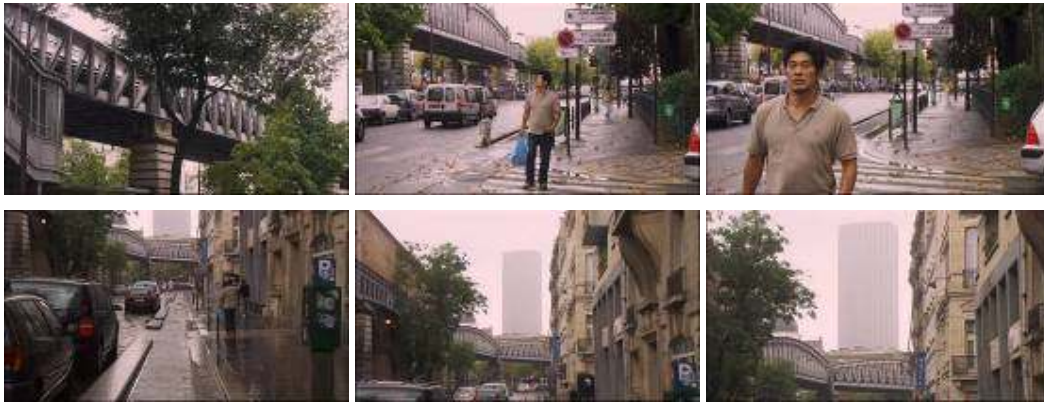
Noche y día: la cámara se mueve para localizar a Kim Sung-nam, un “flannêur” forzoso en París. Y a continuación en busca del edificio que le sirve de referencia para volver a su pensión.

La pérdida de relevancia del individuo en el contexto de la sociedad-red dota al perspectivismo de Hong Sang-soo de una cualidad diferencial respecto a los perspectivismos narrativos de principios del siglo XX. Y esto se hace visible en el protagonismo compartido no sólo con los otros, sino también con los objetos. En contraste con los planos vacíos de Ozu, los de Hong Sang-soo no sirven meramente para puntuar o suspender la acción, sino para poner de relieve los objetos o los escenarios que la cámara en cada momento mira. Ozu ampliaba el campo, situaba a sus personajes en un flujo permanente del tiempo del que eran garantía los trenes, el ciclo del día o de las estaciones, los paisajes en movimiento de las ciudades... Hong no amplía el campo, sino que muestra que el de las cosas inertes es el mismo que el de los seres humanos. Sus planos muertos no abren el espacio de la trascendencia, más bien cierran esa vía y devuelven la atención hacia el único lugar en que una alternativa satisfactoria es posible, el espacio de la intersubjetividad sostenida en el diálogo. Una intrascendencia dolorosa y amarga, pero también el único modo en que el individuo puede escapar a su soledad momentáneamente y disfrutar de una expansión de sí en el otro.