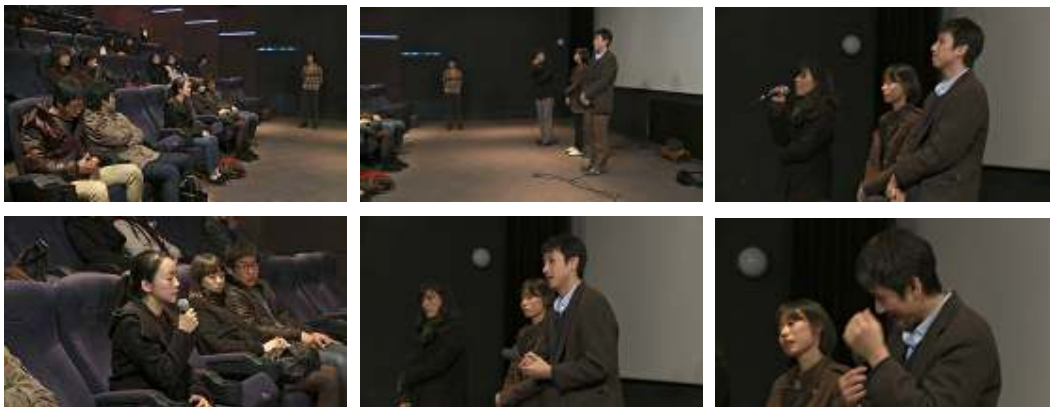
Oki's Film : Jingu interrogado por una espectadora sobre su vida personal. Plano-secuencia, utilizando zoom y barrido.

apertura de un nuevo campo de exploración formal en una sociedad que renuncia al misterio. La decisión de Hong Sang-soo de basar su narración en las divergencias entre memorias y perspectivas y no en un misterio que sólo el autor conoce o puede revelar apunta en esta dirección. La inteligencia intrascendente no sólo suprime el pensamiento religioso, también cuestiona la posibilidad de la literatura y el arte entendidos como sustitutos de la religión y por tanto preservadores de una actitud trascendente. Buena parte de la creación artística y literaria moderna se fundó sobre la existencia de bolsas de misterio en la conciencia y en la cultura de las sociedades contemporáneas. ¿Qué ocurre cuando todo misterio resulta erradicado, cuando la ciencia o el pensamiento son capaces de explicarlo? ¿Qué tipo de producción artística es posible en esta nueva situación? La narrativa intrascendente de Hong Sang-soo constituye una de las posibles respuestas a esta pregunta. Pero lo que Hong Sang-soo muestra es al mismo tiempo un ejemplo de intrascendencia y la representación de la última batalla del ser trascendente contra sí mismo. Al igual que Cézanne no quiso renunciar a la pintura de naturaleza, tampoco Hong Sang-soo quiere renunciar a la narración cinematográfica en cuanto forma artística. Sin embargo, sus personajes le contradicen: Oki le contradice, y su película parece mucho más adecuada a la experiencia actual que la película de aprendizaje filmada por su compañero Jingu.