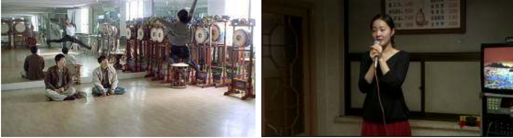
La puerta de la vuelta: Myeon-sook danza frente a Gyung-soo y su amigo / Un cuento de cine: karaoke de Yeong-sil en el homenaje a Lee Hyong su

condición es la de ser visible: la existencia social del individuo depende de su visibilidad; en segundo lugar, de su capacidad para influenciar de alguna manera la percepción, la emoción o pensamiento de los otros. En un mundo intrascendente, desaparecer socialmente es dejar de existir. Por ello los personajes no reconciliados deben esforzarse continuamente por mantenerse visibles, pero también aquellos reconciliados con su forma de vivir y de ser sienten la necesidad de incursionar eventualmente en el terreno de la visibilidad.