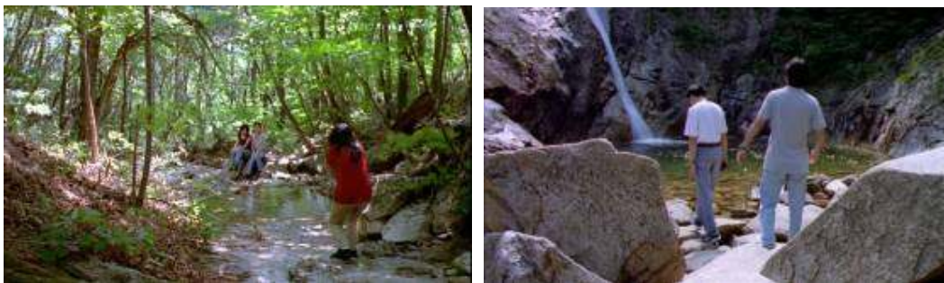
El poder de la provincial de Kangwon: la naturaleza domesticada como extensión de la ciudad.

Ser visible no garantiza la interacción y mucho menos la comunicación, ni siquiera en el espacio de la cotidianidad urbana, ni en el de la expansión de ésta en la sociedad virtual en red. Más bien, los instrumentos de comunicación parecen diseñados para la multiplicación y dispersión de las relaciones, para la fragmentación y atomización de los relatos, en definitiva, para transmitir información sin comunicar experiencia. Es cierto que los personajes de Hong Sang-soo no son adictos al móvil y parecen analfabetos informáticos (excepto para editar vídeos); sin embargo, sus formas de relacionarse traducen físicamente esos modos de fragmentación y dispersión propios de la metrópolis virtual. Incluso cuando salen de la ciudad (y muchas películas se desarrollan en escenarios no urbanos o al menos fuera de Seúl), su comportamiento sigue siendo el de urbanitas, prácticamente ajenos al entorno físico que ocupan o que les rodea.