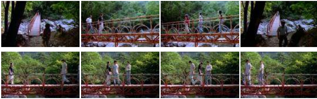
El poder de la provincial de Kangwon: desencuentro (1a parte) y encuentro (2a parte)

La liberación de la temporalidad metafísica (y de la perspectiva de eternidad) abre el tiempo de la oportunidad, pero en la forma de un presente cargado de memoria y anticipación. El vivir este presente con nostalgia o pragmatismo, con angustia o placer depende de cada individuo y de la narrativa en la que junto con quienes en cada momento componen su red social se inscriba. La narrativa fragmentaria de Hong Sang-soo es también consecuencia de esa búsqueda por hacer coincidir las historias, esa búsqueda de un presente perfecto que quizá sólo es visible cuando aún no ha ocurrido o cuando ya es pasado. En su imperfección, el presente aparece, en cambio, cargado de memorias y de deseos que no coinciden, como tiempo de cruces, coincidencias y desencuentros.