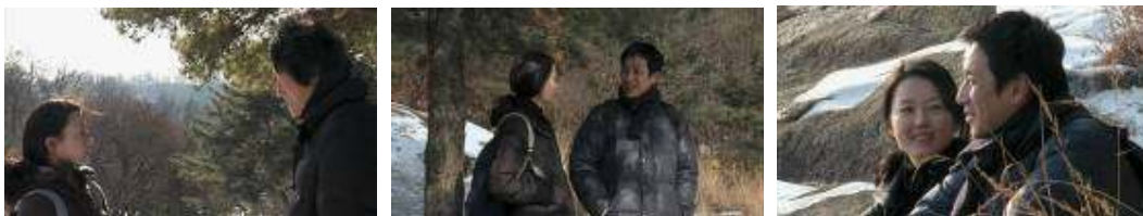
La película de Oki: Oki lleva a sus dos amantes al mismo lugar. Con el más joven, sube más alto.

que sus películas tratan sobre la vida cotidiana y sobre la moralidad en las relaciones humanas. La réplica airada del joven director no es una respuesta convincente, sino más bien una huida hacia delante que a nadie, ni a sí mismo, satisface. Sólo la intervención de la moderadora lo salva de la situación. Su negativa a responder es también una negativa a ver, una desesperada tentativa de mantener esa pequeña cuota de misterio a la que el artista contemporáneo no quiere renunciar. A los reproches de los otros (que siguen siendo público ) el artista siempre puede replicar: “no me comprenden”, y negarse a explicar aquello que no se comprende, porque en ese silencio radica su autoridad, su libertad. Pero también el desconocimiento, su propio desconocimiento.