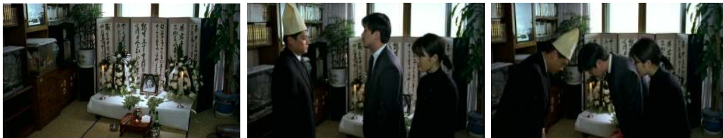
El día que un cerdo cayó en la fuente: Bo-kyeong sueña su propio funeral

de morir o se tiene noticia de su muerte de manera indirecta o diferida. La representación de la muerte ha constituido el principal recurso de las religiones para justificar y mantener el gran negocio de la trascendencia. El miedo a la muerte y a lo que puede ocurrir tras la pérdida final de la consciencia abre el terreno de la fantasía convertida en revelación. Y lo que la mayoría de las religiones proponen para exorcizar ese miedo es morir anticipadamente, poco a poco, día a día: para ganarse la vida eterna hay que renunciar en parte a ésta y aceptar prohibiciones, limitaciones y sacrificios. El ayuno, la abstinencia sexual, la oración o el amor a seres inexistentes atentan contra aquello que es necesario para la vida: la nutrición, el placer, la reproducción, el descanso, la comunicación con los seres vivos. Es comprensible que en una narrativa intrascendente se prescinda de su representación. La muerte sólo es importante en tanto afecta a los otros, a los vivos, que son los únicos protagonistas posibles de la acción dramática. Por ello se evitan los funerales (excepto en los sueños) y la recreación en la descomposición de los cuerpos.