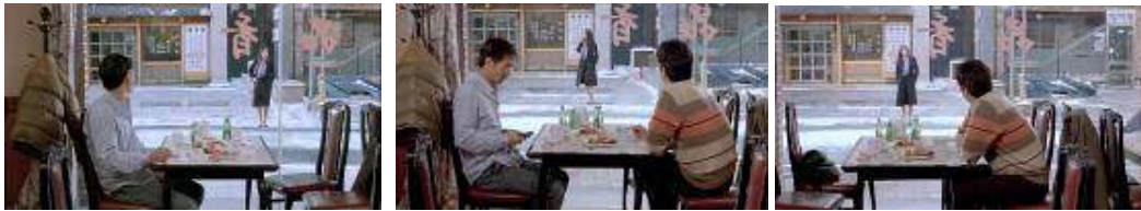
La mujer es el futuro del hombre . Relación visual a través del escaparate. Hay un largo flashback provocado por la visión de la desconocida entre la imagen primer ay la segunda.

Los desplazamientos por la ciudad, en coche o a pie, tienen la función de espacializar una comunicación multifocal que se desarrolla como una constante alternancia de encuentros y desencuentros, coincidencias y abandonos. El cuerpo vuelve a adquirir protagonismo, la soledad se hace física y la búsqueda requiere un esfuerzo integral. Si el taxi establece o anula la distancia, el escaparate (de la tienda o del restaurante) hace posible la coincidencia y el reconocimiento: el dispositivo de exposición propio de la ciudad espectacular funciona también como eje para el establecimiento de la perspectiva.