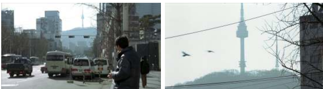
Un cuento de cine: la torre de comunicaciones visible desde toda la ciudad.

El sol cierra la primera parte de Un cuento de cine del mismo modo que la torre de comunicaciones de Seúl la abre. Pero en tanto la presencia del sol es puntual, la torre es omnipresente; “se ve desde toda la ciudad”, observa Dong su al inicio de la segunda parte poco antes de repetir la secuencia del encuentro con Yeong-sil. En cierto modo, la torre constituye el anclaje para unos personajes que deambulan por la ciudad como flotando a causa de la sobre-exposición de ficción y realidad en sus trayectos, la descoordinación y falibilidad de sus memorias y la fragilidad de las relaciones que los unen y separan. La torre de comunicaciones sustituye al sol como símbolo de la nueva trascendencia, la que se basa no en la postulación de realidades paralelas o póstumas, sino en la posibilidad real de la comunicación a distancia, de la comunicación en ausencia. En otros tiempos, el individuo sólo podía hablar en soledad con dios o con los muertos, la comunicación en ausencia pasaba necesariamente por un cielo inmaterial. Ahora esa comunicación atraviesa la atmósfera, la que da color a lo que llamamos “cielo”, y sabemos que es posible por el movimiento de las ondas y la existencia de emisores-receptores electrónicos. La comunicación electrónica ha ganado la partida al arte en su pugna por constituirse en alternativa a la trascendencia imposible.