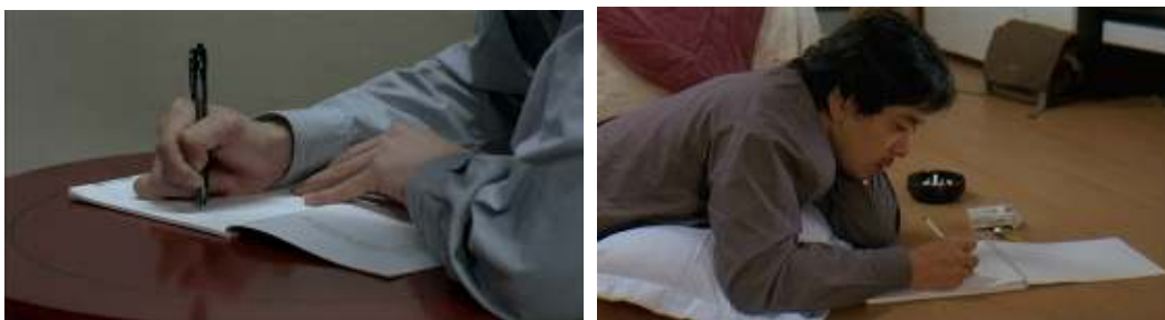
Un cuento de cine: San-wong escribe en su recién comprado cuaderno antes de suicidarse / Una mujer en la playa: Joong-rae escribe el tratamiento de su película

Se diría que el director modela cada uno de los fragmentos con la paciencia y con la habilidad del artesano. La artesanía cinematográfica se hace visible en la relevancia que en alguna de sus películas adquiere la sala de edición, pero también en el ejercicio de la escritura manual al que se entregan algunos personajes. Se escribe en hojas de cuaderno, pero con esfuerzo, como si el trabajo intelectual de la escritura debiera