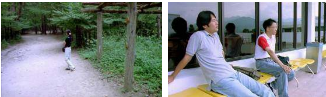
El poder de la provincial de Kangwon: los personajes esperan más que actúan

La condición más evidente de ese presente imperfecto es la de la espera. Los personajes están aquí, con su cuerpo e incluso con su pensamiento, pero sólo en función de algo que ya ha ocurrido o que aún debe ocurrir. Hay esperas solitarias y esperas en compañía: ¡triste destino el de esos personajes (amigos casados, amigas sin pareja) cuya única función es la de acompañar la espera! Se espera la oportunidad del trabajo, la de la creación, la del amor, la del cambio o, en algún caso patológico, la de la muerte. Y lo que la espera abre es un tiempo muerto , es decir, una cotidianidad suspendida.