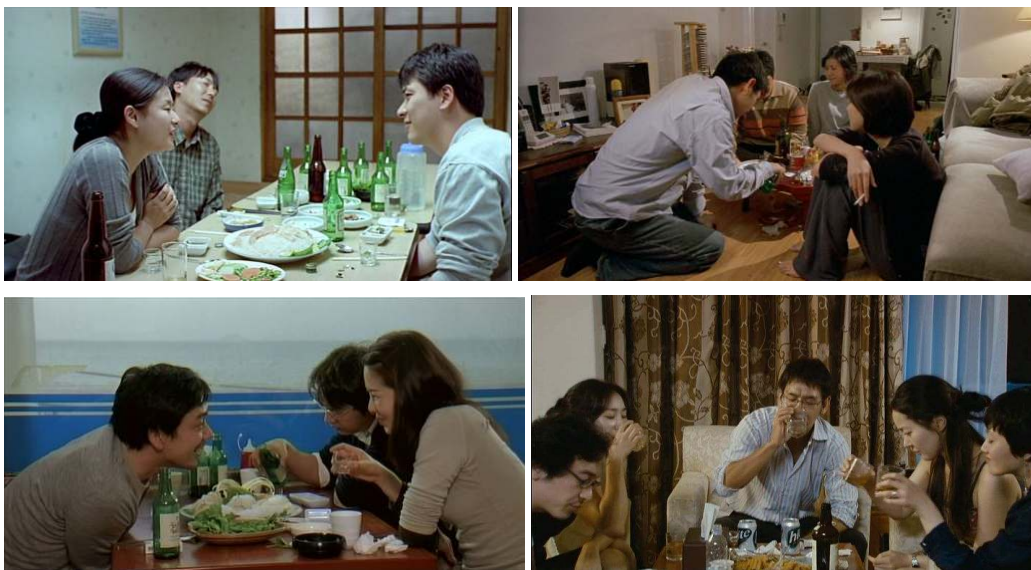
La puerta de la vuelta / La mujer es el future del hombre / Una mujer en la playa / Como lo sabéis todo: el alcohol omnipresente.