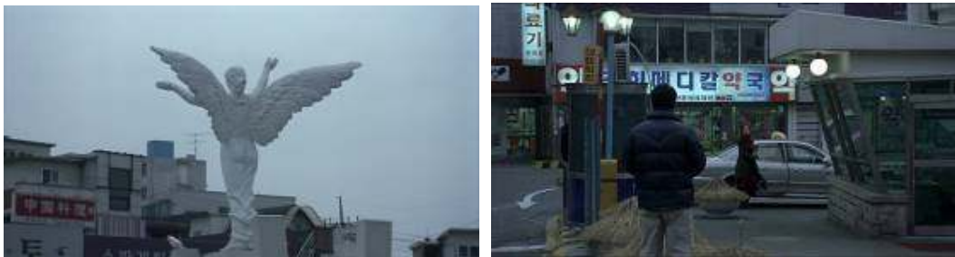
Un cuento de cine: Dong-su encuentra a Yeong-sil bajo la estatua del ángel en la entrada del hospital

La muerte no es el final. El final es la soledad. Pero el final no es lo más importante. O al menos esto parece desprenderse de la propuesta narrativa de Hong Sang-soo. El ángel permanece, porque ya estaba muerto, o más bien nunca estuvo vivo, o nunca existió. La mujer sigue su camino. Y el hombre debe decidir. Hong Sang-soo decide obviamente por sus personajes: les retrata obsesionados por el pasado o por su futuro profesional, les hace desear compulsivamente a las mujeres, les humilla, les regala placer y finalmente les condena a una nueva etapa de soledad, no necesariamente