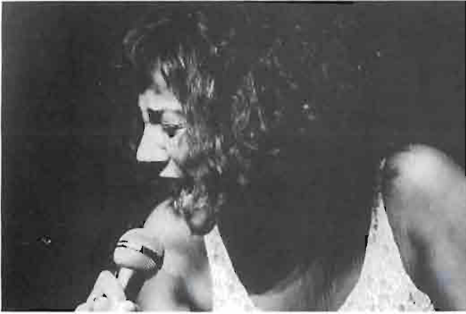
Maria João Quinteto