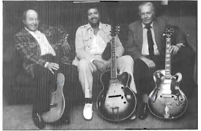
The Great Guitars