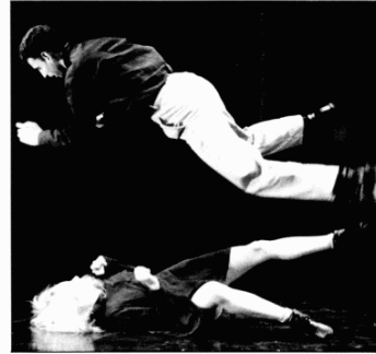
Imágenes de "Canard pékinois", de Josef Nadj, y "Las portadoras de malas noticias", de Vandekeybus.