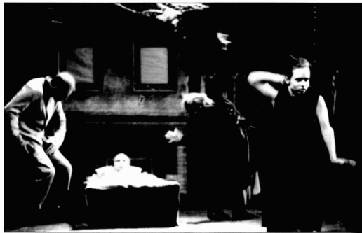
Escena de "Siete pieles de rinoceronte", de Josef Nadj.

sef Nadj— evoca la expresión húngara que se utiliza cuando alguien dice una palabra por otra, voluntaria o involuntariamente: "hacer el pato". "En Hungría se habla mucho así debido a la censura, para tapar la verdad. Lo de Pekin es por la referencia a otro lugar". "El humor es también un hilo conductor. Es una cuestión de verdadera o falsa imagen. Este sentido del humor, algo siniestro, es algo hereditario en mi familia, en mi provincia, en la forma en que la gente cuenta relatos". Nadj confiesa que Canard Pékinois (espectáculo en el que par-