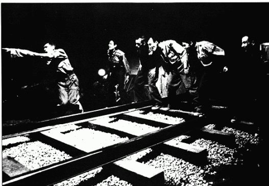
Carbone 14 escenificará "Le rail" en vivo y en directo, en la estación de RENFE.