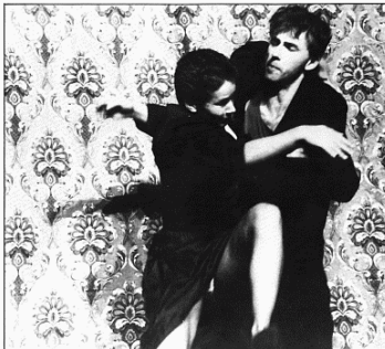
Egipontenteater (Bélgica): "Incidenti".