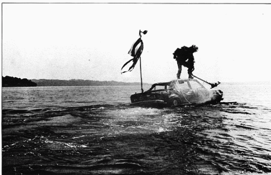
Royal de Luxe (Francia): una producción propia del festival.

1996. El mundo del fin del tiempo (España), Días 16 y 17 de mayo. Palacio de Carlos V, 22.30 horas. Producción de Movimiento (Madrid), del Centro Nacional de Nuevas Tendencias y del Festival Internacional de Teatro de Gra-