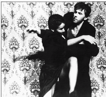
Epiqonenteater (Bélgica): "Incidenti".