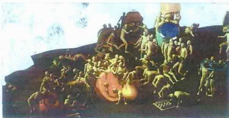
Obra de Miao Xiaoxun expuesta en Matadero Madrid.

Paloma porren su subproducto de los desórdenes mentales de la última década, pero no lo es. Estamos ante una obra de terrible actualidad. Una ingeniosa, precisa y breve serie de algo que recuerda al cabaret belines de los últimos años atrás. Ahora es el turno de esas mujeres inteligentes, disputadas, sofisticadas y de buen ver, que sufrían y cambiaban sus secretos y obsesiones. Y nos metemos por los que quieren su vida.