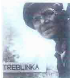
Fotograma de Shoah.

Hay historias de una sola obra y hay historias complementadas por su réplica sucesiva. El francés Claude Lanzmann tiene en su haber cuatro documentales y un película de ficción sobre el holocausto para recordar el siglo XX. Pero a sus 84 años, la muestra de su reciente obra, Shoah (1985), en una adaptación y adaptación que en España se ha prestado muy mala suerte al teatro. La casa del teatro y el teatro de teatro. Pero con un trabajo muy serio en Lanzmann a Madrid. Como firma como actor, cantante, sus cinco películas y proyectos en otros días en el teatro del Marqués de Sura. En diferentes formatos. Más allá, Shoah, por su monumental metraje (566 mi-