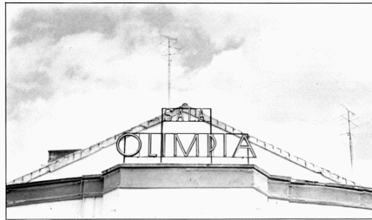
El C.N.N.T.E. ya tiene la Sala Olimpia en exclusividad.

—Seguiremos programando en la San Pol, porque es un espacio