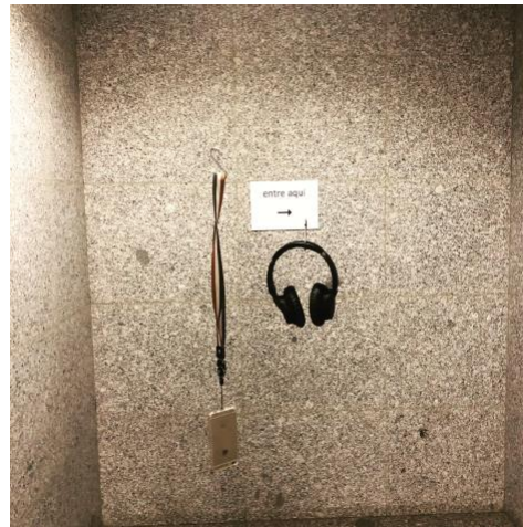
Figura 3 – Auriculares, móvil, cartel [Fotografía].

El sociólogo Erving Goffman investigó sobre el modo en que nuestra experiencia se organiza a partir de construcciones de lo real que adquieren sentido al articularse unas con otras 6 . Un marco “[...] es un dispositivo cognitivo y práctico de atribución de sentidos, que rige la interpretación de una situación y el compromiso en esta situación, ya sea que se trate de la relación con otro o con la acción en sí misma” (Isaac, 1999, p. 63):