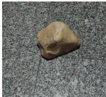
Figura 1 – Piedra [Fotografía].

Diversas teorías, enfoques y herramientas conceptuales contemporáneas comparten el interés por reformular los modos de relación del ser humano con el medio desde una perspectiva crítica frente a la naturalización de las categorías humano-no humano, individuo-sociedad, cuerpo-mente y naturaleza-cultura. En el contexto expandido de este debate se sitúan las investigaciones de Isabelle Stengers con el concepto de ecología de las prácticas, que da valor a la multiplicidad de singularidades y formas de producir y estar en el mundo; Donna Haraway, cuando señala modos de agencia entre humanos y especies de compañía; el concepto de actor-red de Bruno Latour, por contemplar el principio de simetría en las relaciones entre personas y máquinas; o, como lo analizaremos en este artículo, el perspectivismo amerindio de Viveiros de Castro, que propone observar la inversión de las categorías naturaleza y cultura desde el punto de vista indígena como apertura a otras formas de interacción con el mundo.